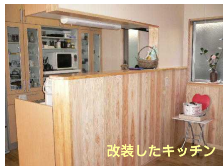
改装したキッチン