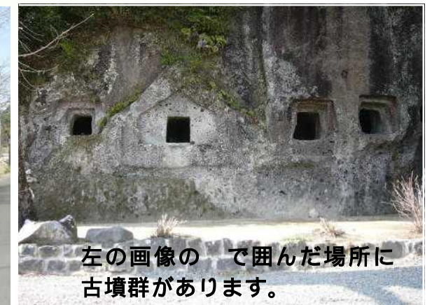
左の画像の で囲んだ場所に古墳群があります。