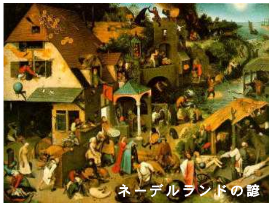
ネーデルランドの諺