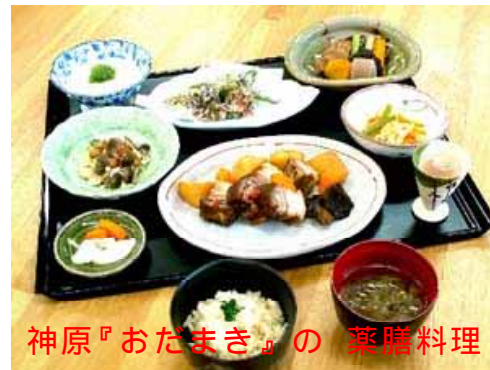
神原『おだまき』の薬膳料理

薬膳とは、中国に古来より伝わる食養生の方法ですが、ただ単に薬草を入れた料理を指すわけではありません。食材に含まれる成分を把握して食べ物同士の調和をはかり、人の健康により良い組合せのメニューで食べさせるのが薬膳料理です。荒涼としていた風景にも段々と色が付き、新しい息吹で満ち溢れているこの季節に野山で採れる よめな ぎしぎし のびる などの旬菜は、薬膳料理の格好の食材となります。春の旬菜で作った『薬膳料理』皆さんも一度試してみたいですか。