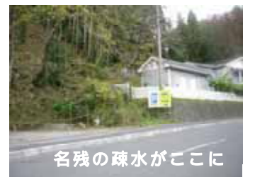
名残の疎水がここに

先人たちの努力によって大分県でも一番早く電灯が点った事は、当時の竹田の技術力や文化の高さを今日に伝えていきます。